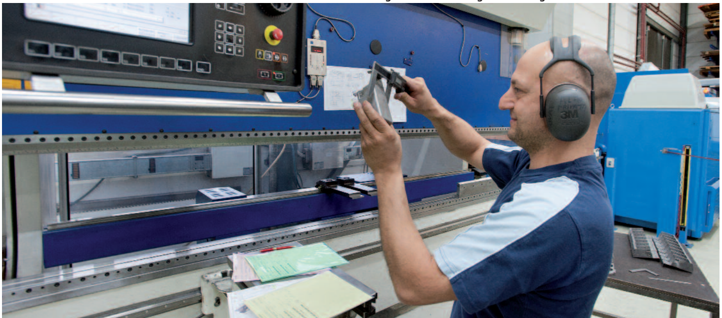
Die Trumpf Abkantmaschine bringt die flachen Blechteile in die passende Form.