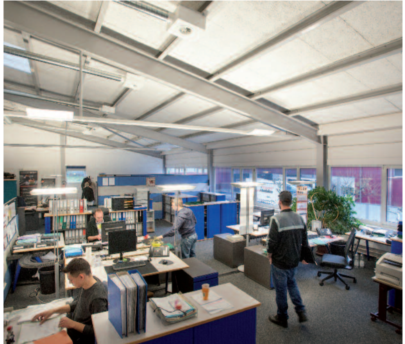
Neues Auftragscenter mit Auftragsbearbeitung und AVOR.

gewährleistet ist. Sonderanfertigungen sind ebenso wie bewährte Standardvarianten umsetzbar und nach strengen Qualitätsnormen geprüft. Nach dem Verkauf bietet die Beer Grill AG einen vollumfänglichen Service an und unterstützt ihre Kunden dabei, die grösstmögliche Wertschöpfung aus der Investition zu erzielen. Um noch mehr Flexibilität und Kundennähe zu ermöglichen, wurden bei der Beer Grill AG Anfang 2016 neue Service-Standards eingeführt. So können die Prozesse über die gesamte Wertschöpfungskette fortlaufend überprüft und optimiert werden. Das neu entstandene Auftragscenter mit Auftragsbearbeitung und AVOR verkürzt die Informationswege und Reaktionszeiten. Auch in personeller Hinsicht weht bei der Beer Grill AG ein neuer und frischer Wind: Als Nachfolgerin von Geschäftsführer Kurt Lang zeichnet ab Anfang 2017 Monika Lang zusammen mit ihrem Ehemann Benjamin Bihl für die Geschäftsleitung der Beer Grill AG verantwortlich. Kurt Lang wird als Mitglied des Verwaltungsrates aber nach wie vor mit der Beer Grill AG verbunden sein.