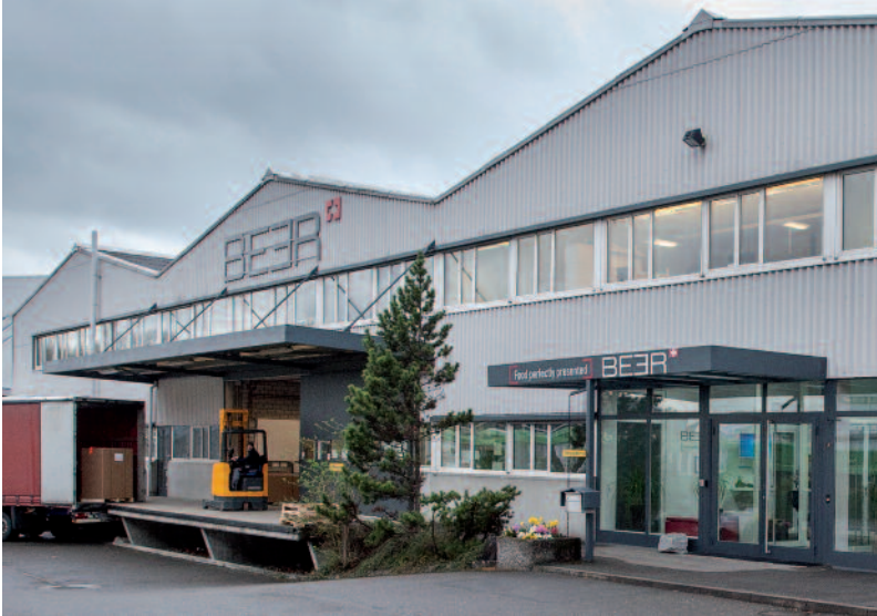
Firmensitz in Villmergen.