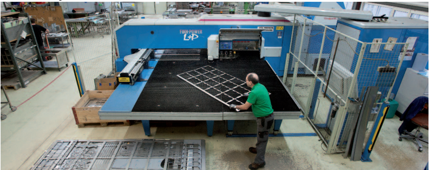
An der Finn Power Laser-Stanzmaschine werden aus grossen Blechplatten die einzelnen Teile gefertigt.