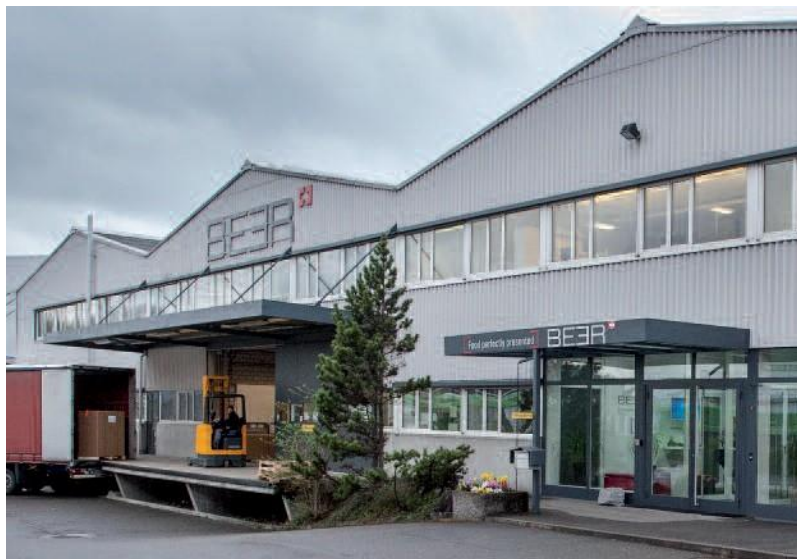
Siège social à Villmergen.

Beer Grill AG est le partenaire de Hiltl depuis de nombreuses années – et ce pour une bonne raison: l'entreprise familiale fait partie de l'un des premiers fabricants d'appareils électrothermiques pour la préparation et la présentation des aliments depuis 94 ans. Depuis sa fondation en 1922 par Arthur Beer, qui a commencé par la fabrication de grils, l'entreprise est devenue la spécialiste actuelle des solutions d'infrastructure de restauration à l'aide de l'électrothermie. Qu'il s'agisse de rôtir, de griller, de cuisiner de façon mobile, de maintenir au chaud/froid, de cuire à la vapeur à air chaud ou au four – la gamme offre des solutions individuelles pour chaque besoin. Les conseils sont fournis de manière compétente et individuelle, sur place ou dans la propre salle d'exposition. Au siège de l'entreprise à Villmergen, tous les produits de l'entreprise sont avec un important