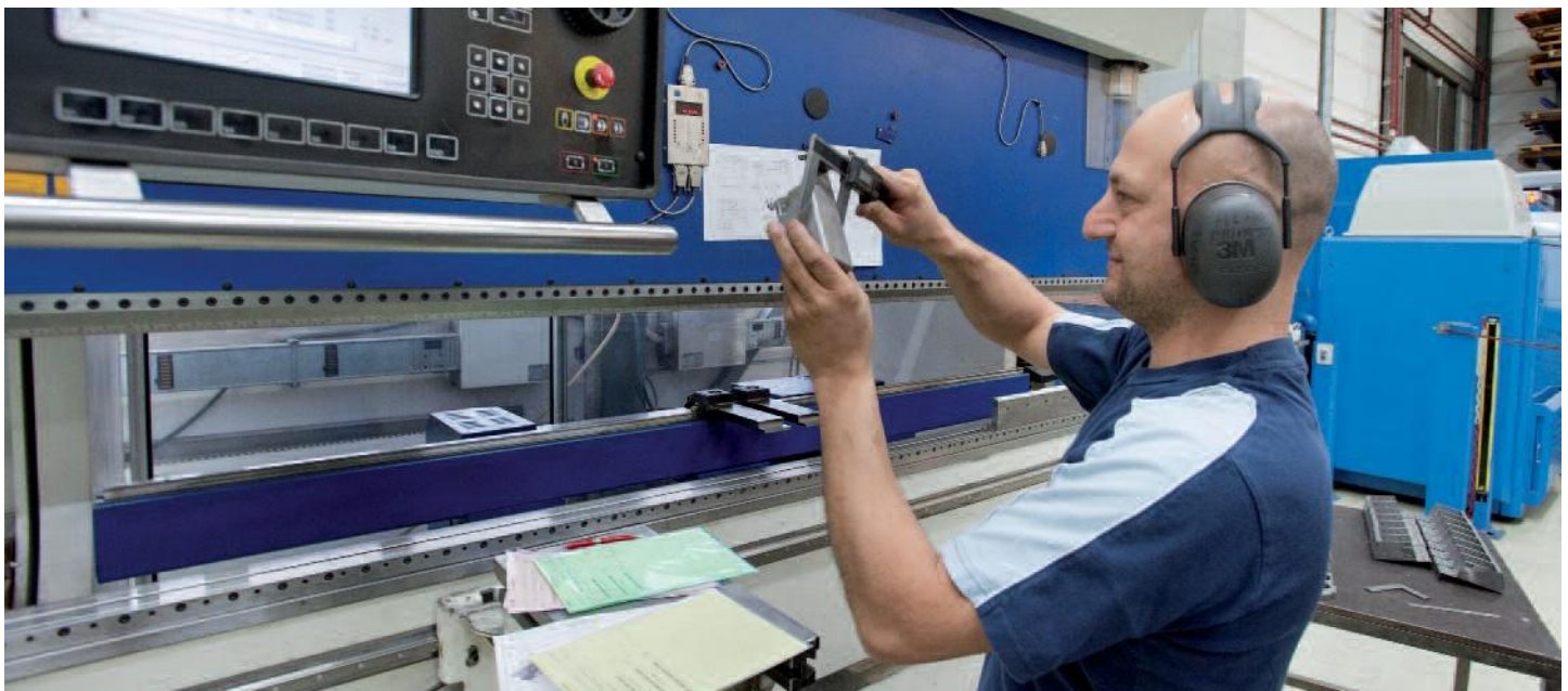
La plieuse Trumpf donne aux pièces de tôle plates la forme voulue.