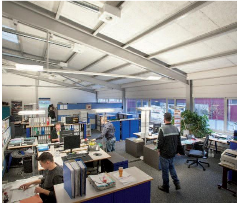
Nouveau centre de commande avec gestion des commandes et AVOR.

travail manuel, ce qui garantit la qualité élevée constante et la durabilité des appareils. Les produits sur mesure sont tout aussi réalisables que les variantes standard éprouvées et testées selon des normes de qualité strictes. Après la vente, Beer Grill AG offre un service complet et accompagne ses clients afin d'obtenir la plus grande valeur ajoutée possible de l'investissement. Pour offrir encore plus de flexibilité et de proximité aux clients, de nouveaux standards de service ont été introduits chez Beer Grill AG au début de 2016. Ainsi, les processus peuvent être revus et optimisés en permanence au travers de toute la chaîne de création de valeur. Le nouveau centre de commande avec la gestion des commandes et la préparation du travail (AVOR) raccourcit les circuits d'information et les temps de réaction. Un nouveau vent de fraîcheur souffle également chez Beer Grill AG en termes de personnel: en tant que successeur du directeur Kurt Lang, Monika Lang est responsable de la direction de Beer Grill AG, avec son mari Benjamin Bihr, depuis le début 2017. Toutefois, Kurt Lang continue à être lié à Beer Grill AG en tant que membre du conseil d'administration.