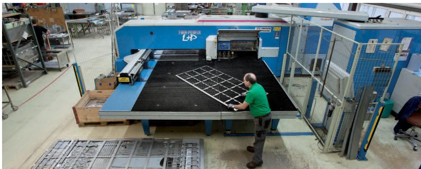
Sur la poinçonneuse laser Finn Power, les différentes pièces sont fabriquées à partir de grandes plaques de tôle.